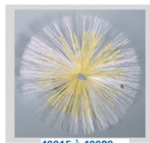
40015 à 40080