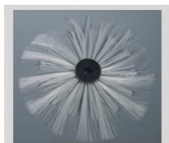
50015 à 50080