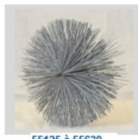
55125 à 55630