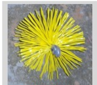
54160 à 54800