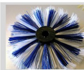
50100 à 51125